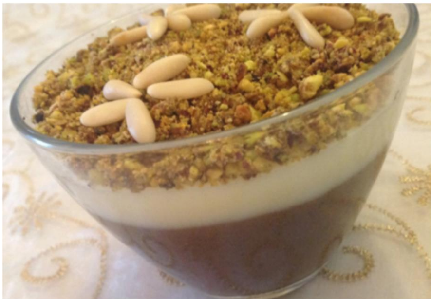
Crème pâtissière garnie de fruits secs